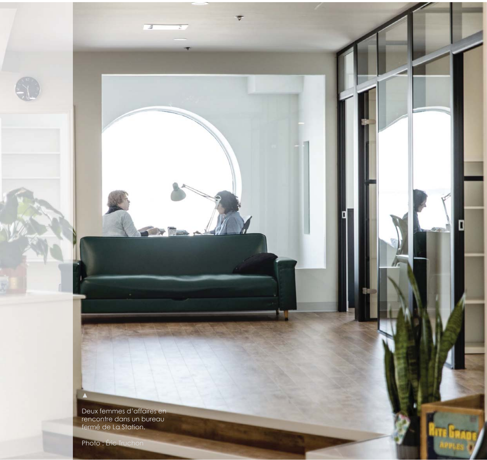
▲ Deux femmes d'affaires en rencontre dans un bureau fermé de La Station.

La Station est un espace de travail collaboratif clé-en-main, là où la collaboration, le partage et la créativité sont regroupés, proposant aux travailleurs indépendants et petites entreprises des locaux, de l'équipement et des services adaptés, les aidant dans le démarrage, la croissance ou l'expansion de leurs projets.